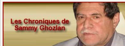
Les Chroniques de Sammy Ghozlan